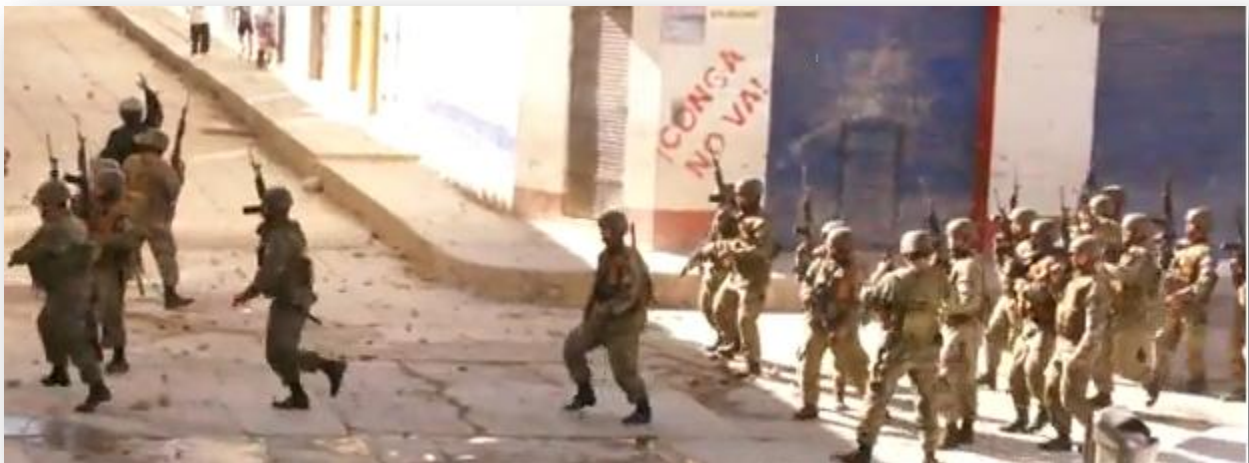
Répression à Bambamarca le 04 juillet 2012 – Images Youtube

Des slogans retentissaient sans relâche tout au long des manifs, et s'étaient jusqu'à très