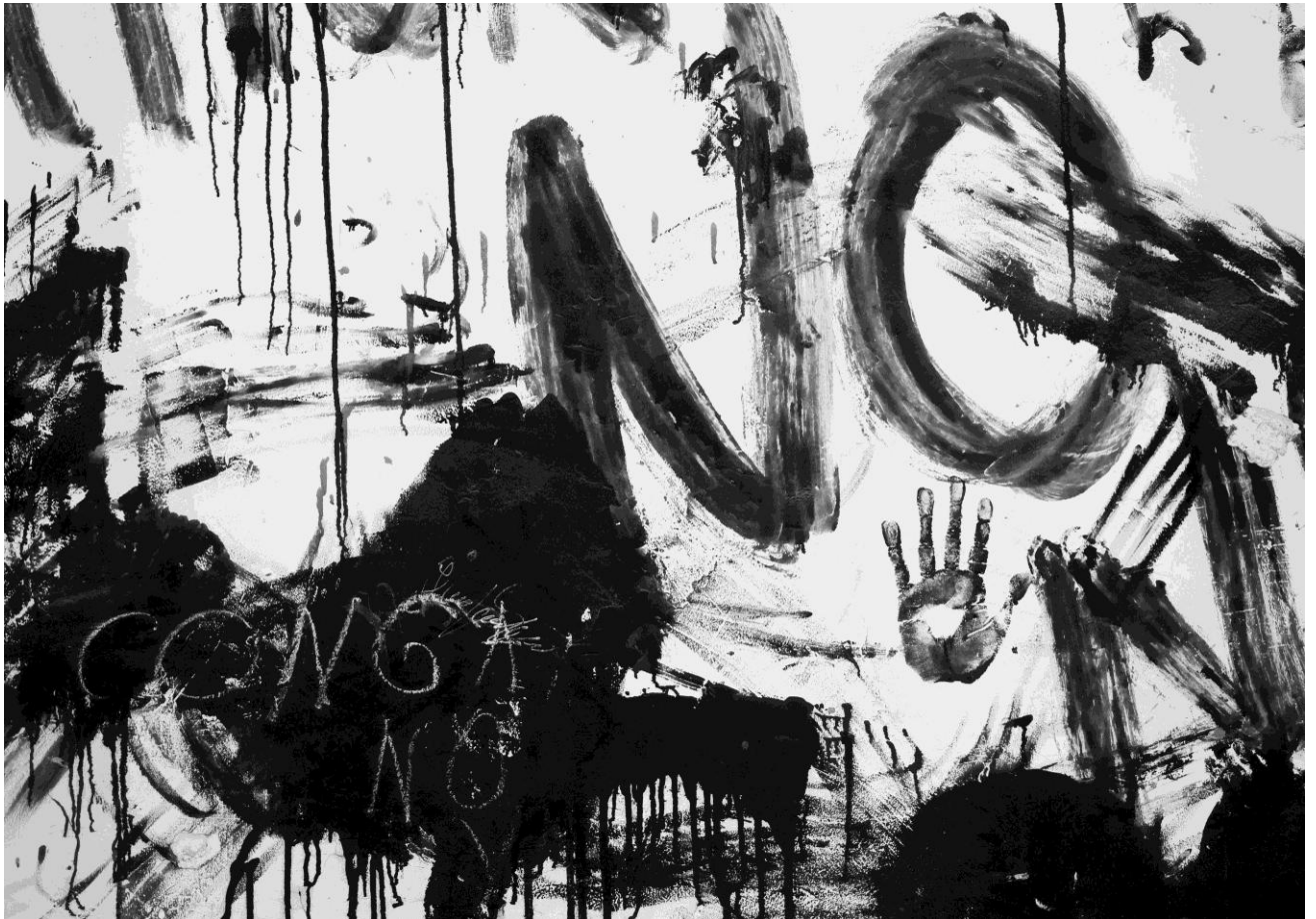
Graffiti sur un mur à Celendín

Dans un précédent article (« La bataille de l'eau au Pérou », SOLAL N° 82, Caen, 2012), nous avons essayé de décrire la problématique socio-environnementale occasionnée par l'action dévastatrice d'une multinationale minière et son projet d'extension nommé Conga, et de la lutte que mène le peuple de Cajamarca dans le Nord péruvien contre le puissant groupe économique Newmont-Buenaventura et son principal allié, l'Etat. Ce texte essaiera de présenter la même problématique d'un point de vue des stratégies populaires, en retraçant l'expérience des Rondes paysannes , expression communautaire où la démocratie prend un véritable sens. Bien que leur ténacité ait permis l'émergence d'un mouvement de résistance prometteur, les risques que leur lutte encoure ne sont pas à négliger.