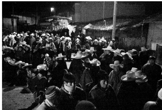
Réunion à Pizon (Celendín) – Philippe Revelli, 2012.

Jusqu'à aujourd'hui, la notion de justicia rondera , la justice paysanne des Rondes , y est bien présente, et c'est d'ailleurs la raison pour laquelle la Ronde s'est légitimée au sein de la communauté. Le passage de la ronde nocturne à la résolution de conflits était « le résultat du succès des Rondes contre le vol de bétail. La quasi disparition du vol permit aux paysans de s'orienter vers la résolution des conflits ; cela conféra aux Rondes une aura de prestige et d'efficacité les transformant en lieu privilégié pour résoudre des problèmes. Vers la fin de la décennie, les Rondes avaient pris à leur charge une énorme quantité des